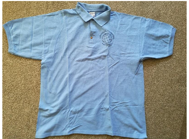
Lichtblauwe polo met logo Huis aan het Water, XL 15 stuks