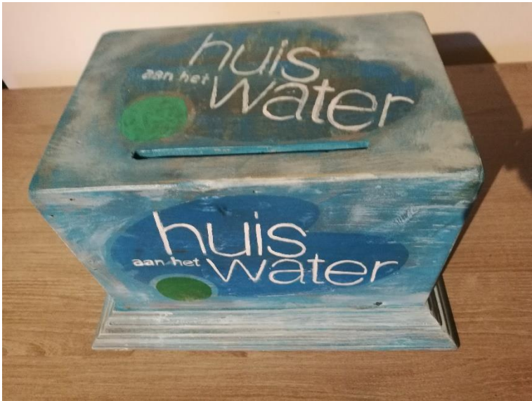
Donatiebox 40 x 25 cm