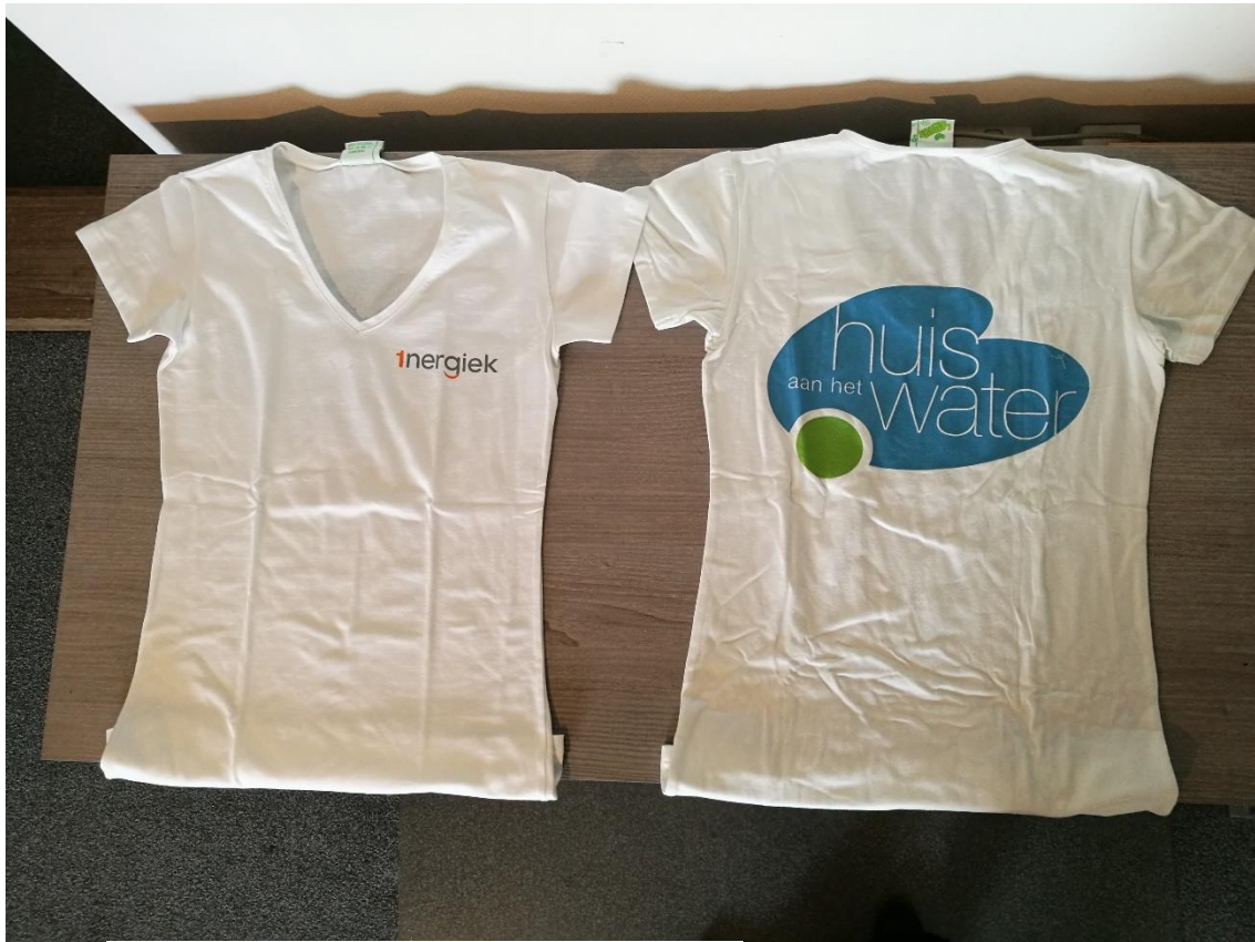
Witte t-shirt met logo Huis aan het Water S,M,L