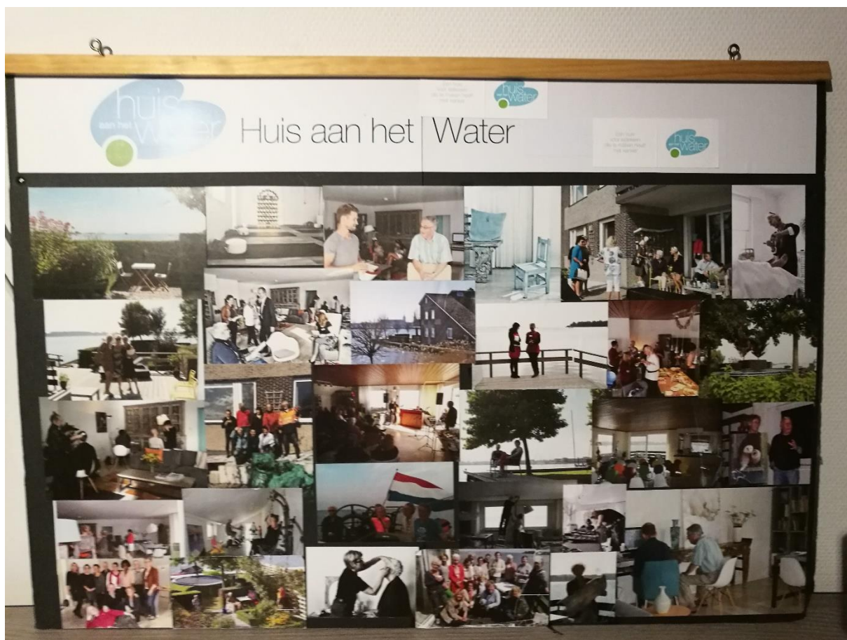
Collagebord met indrukken Huis aan het water 100 x 75 cm