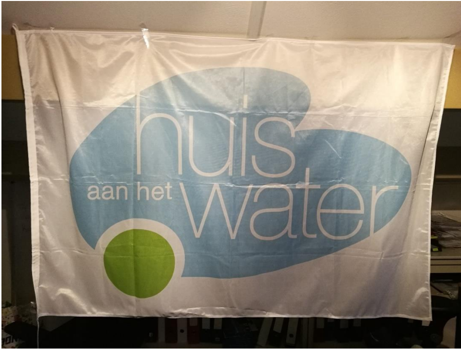
Vlag 150 x 100 1