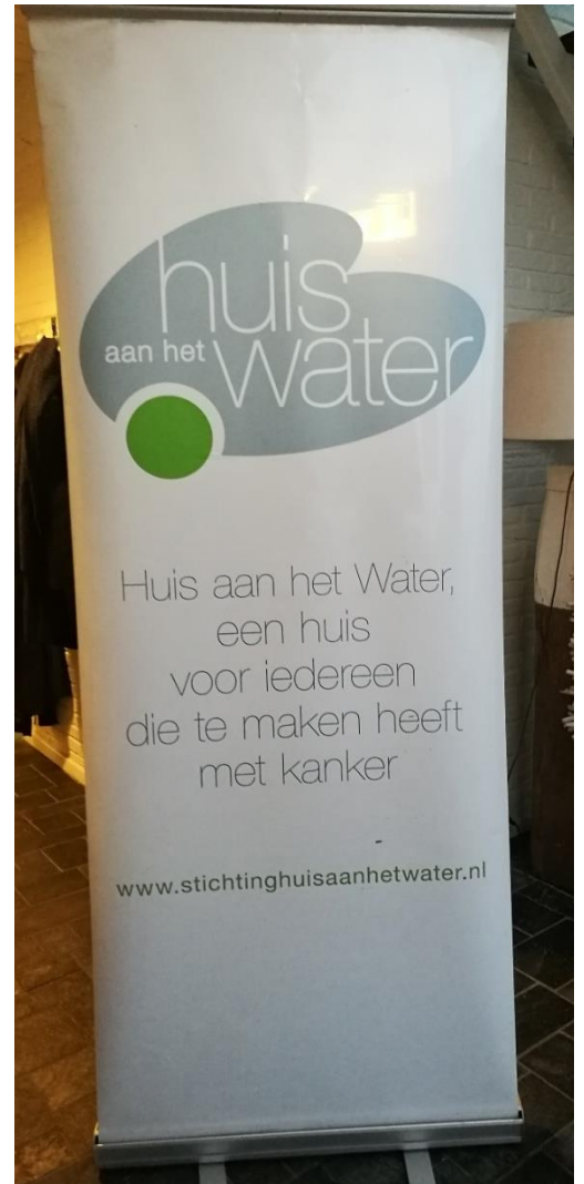
Rolbanner 80 x 200 cm