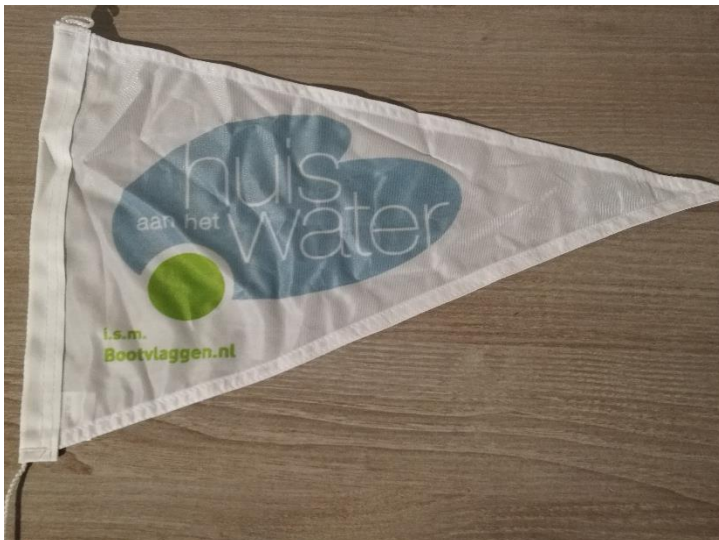
Driehoek vlaggetjes 20 stuks, 25x 25 x 10 cm